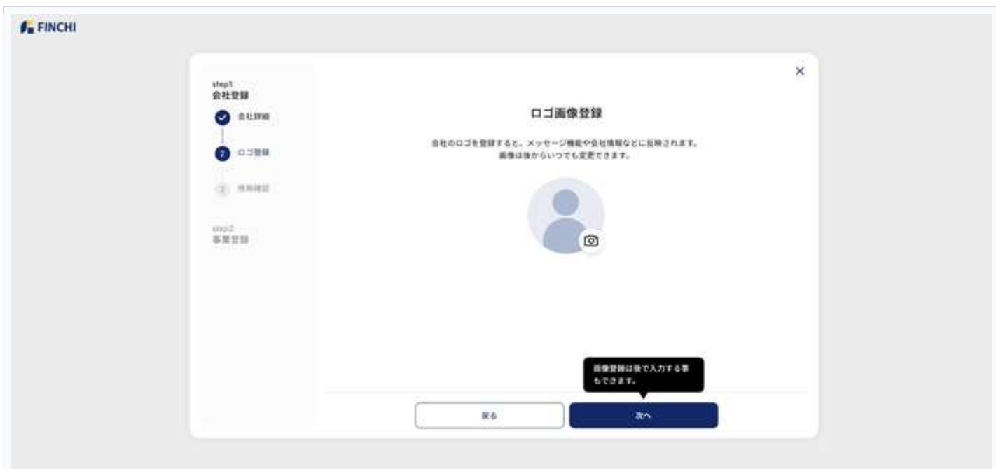
図6：ロゴ画像登録画面 — カメラアイコンをクリックして画像をアップロード後「次へ」をクリック