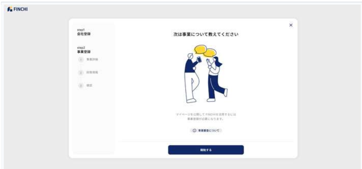
図7：事業登録開始画面 — 「開始する」をクリックして事業詳細の入力へ進む

i 事業登録について： マイページを公開してFINCHIを活用するには事業登録が必要です。事業審査が行われますので、正確な情報を入力してください。