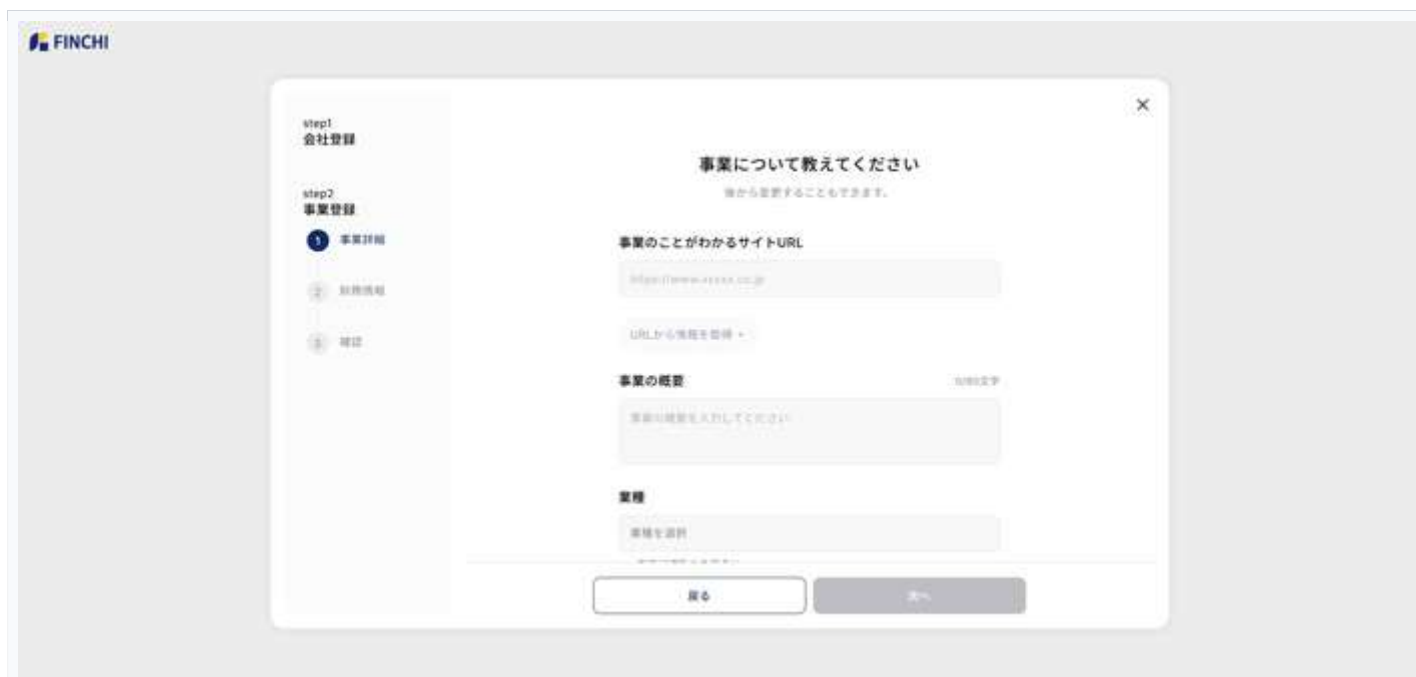
図 8：事業詳細入力画面 — 各項目を入力して「次へ」をクリック