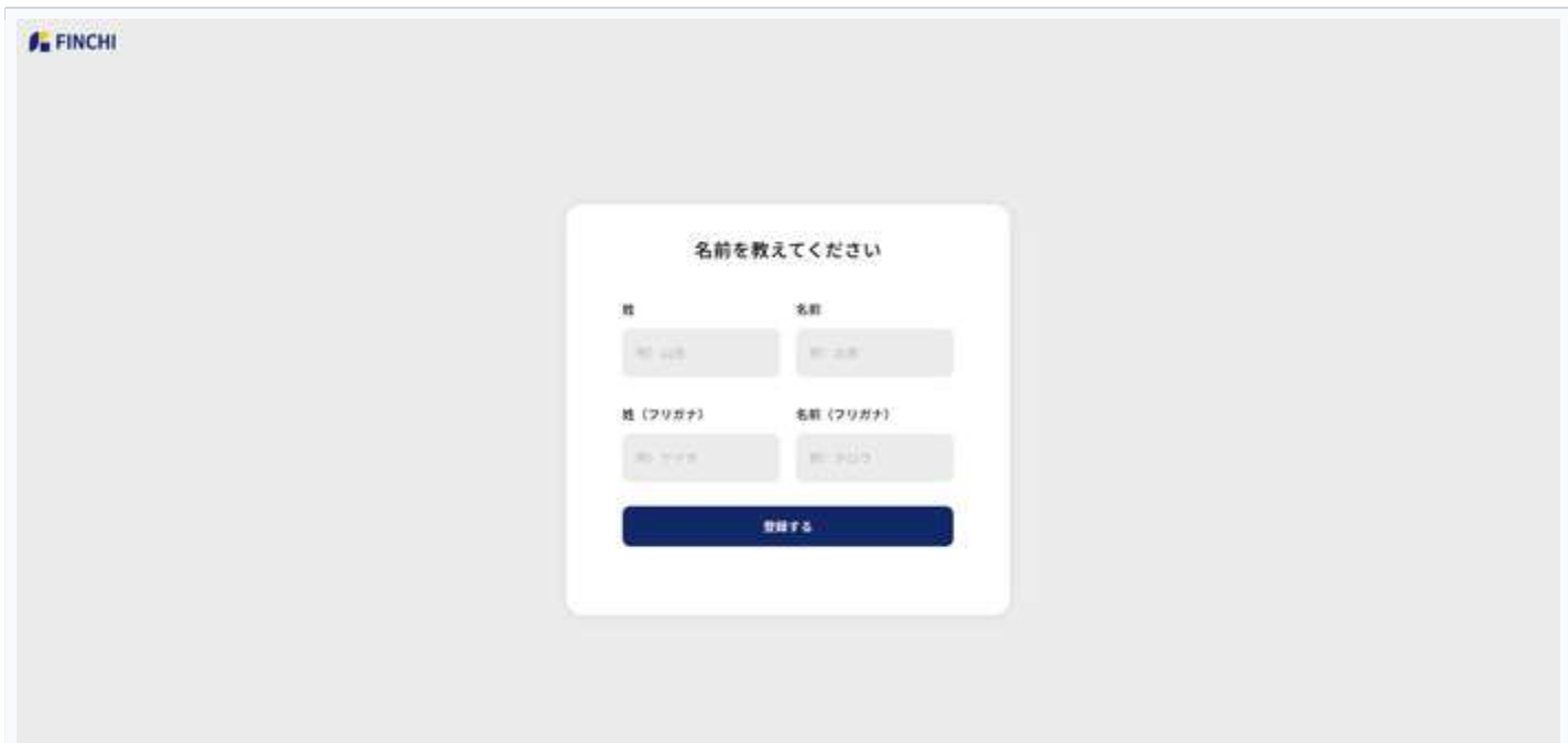
図3：氏名入力画面 — 姓名とフリガナを入力して「登録する」をクリック