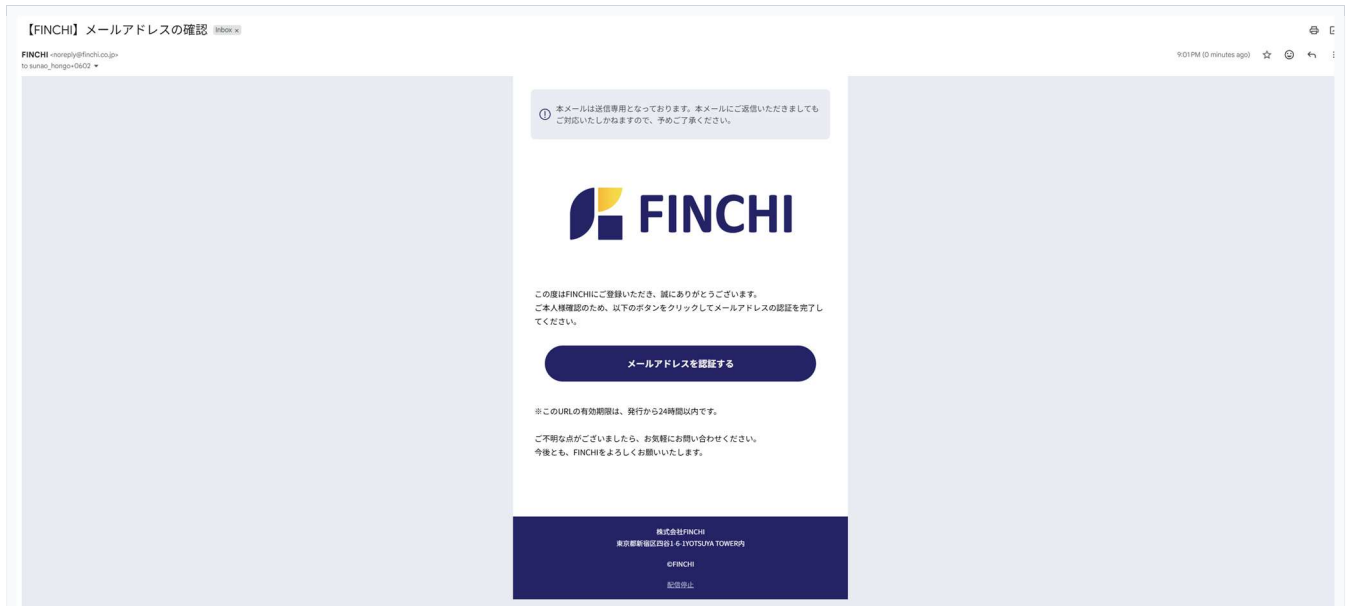
図2：確認メール（Gmail表示例） — 「メールアドレスを認証する」ボタンをクリック

⚠ メールが届かない場合： ①迷惑メールフォルダを確認 ②数分待ってから再確認 ③再度新規登録