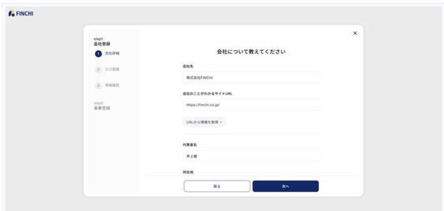
図5: 会社詳細入力画面 — 各項目を入力して「次へ」をクリック

💡 便利機能: サイト URL を入力して「URL から情報を取得+」をクリックすると、会社情報が自動で入力されます。活用することで入力の手間を省けます。